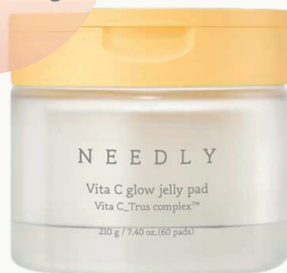
Vita C glow jelly pad (60 pads/210g)

Эксклюзивный ингредиент Needly, комплекс Vita C (какадуплюм, цитрон, экстракт грейпфрута) сделает тусклую и уставшую кожу чистой и яркой