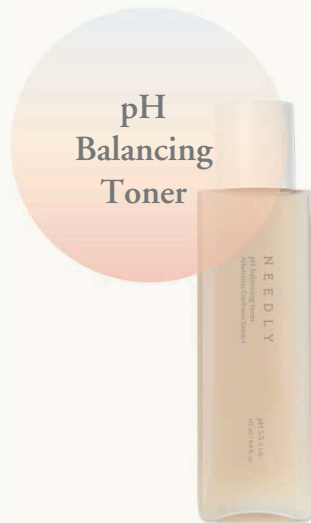
Балансирующий тонер для лица

Уход для поддержания здоровой кожи, балансируя pH, влажность и кожное сало.