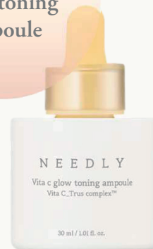
Needly Vita c glow toning ampoule