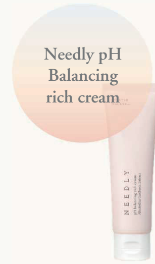
Балансирующий крем для лица