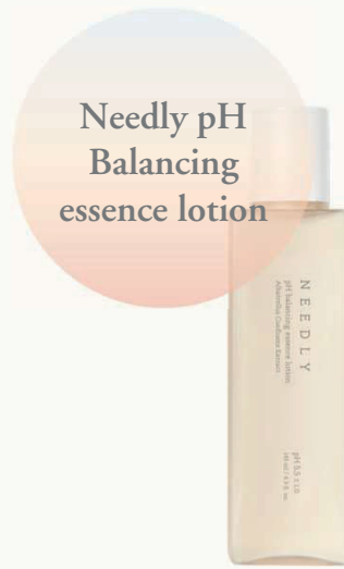
Балансирующий лосьон для лица