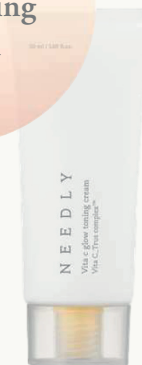
Needly Vita c glow toning Cream